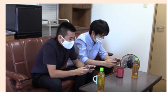
ドラマ「闇バイトへの誘い」