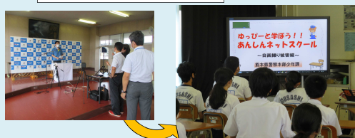
熊本市立武蔵中学校 (令和2年7月31日)