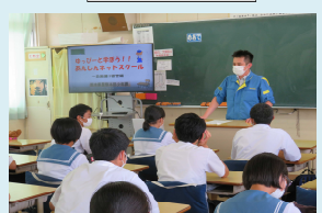
御船町立御船中学校 (令和2年8月5日)