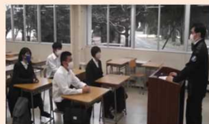
ドラマ「その投稿 大丈夫？」